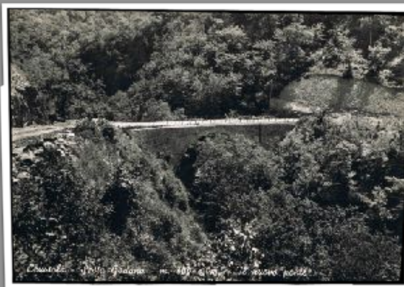
Il nuovo ponte che sovrasta quello precedente foto degli anni 60

L'indomani si recò sul luogo con i fratelli e, alla vista del crollo e pensando al pericolo corso, rimase talmente impressionato che morì.